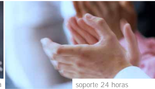
soporte 24 horas